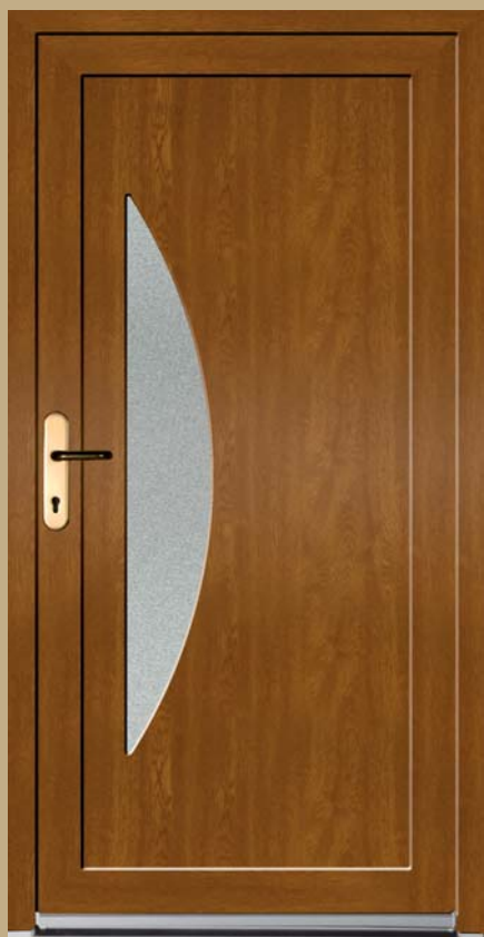
■ K 106 L