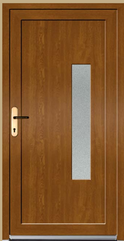
■ K 103 P