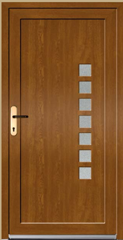
■ K 109 P