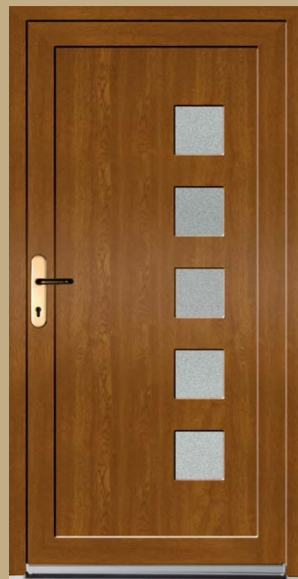
■ K 108 P

PICASSO STYL dveřní výplně mají řadu výhod v kvalitě, originalitě a technologii výroby. Použitím rámečku z interieru se může rozbité sklo ve výplni jednoduše vyměnit. Pro výrobu používáme nejčastěji ornamentní skla kůra čirá, grepi, činčila čirá a master care čirý, které máme skladem a všechna dostupná ornamentní skla na našem trhu.