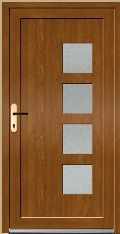
■ K 110 P