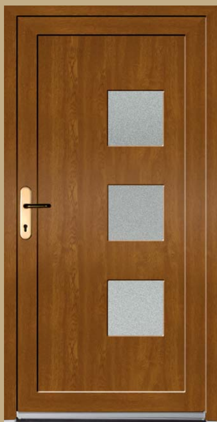
■ K 104 P