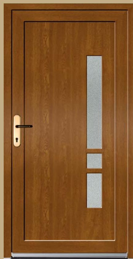
■ K 105 P

Dveřní výplně PICASSO STYL provedení KLASIK se vyrábí v bílé barvě z plastové desky. Pro imitaci dřeva z běžně dodávaných folií RENOLIT a HORNSCHUCH je místo plastu použita lisovaná pryskyřice (HPL). Z venkovní strany je sklo pod úrovní desky a z vnitřní strany je u plastových výplní bílý plastový rámeček tloušťky 2 mm a u HPL výplní je zevnitř HPL rámeček tloušťky 2 mm.