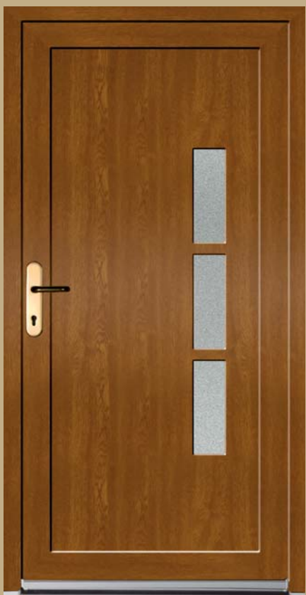
■ K 107 P