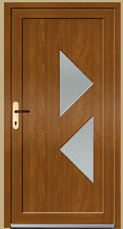
■ K 111 P